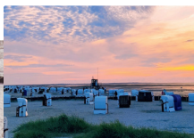
Grün- & Sandstrand in Harlesiel