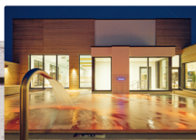
Cliner Quelle | Bade- & Saunalandschaft